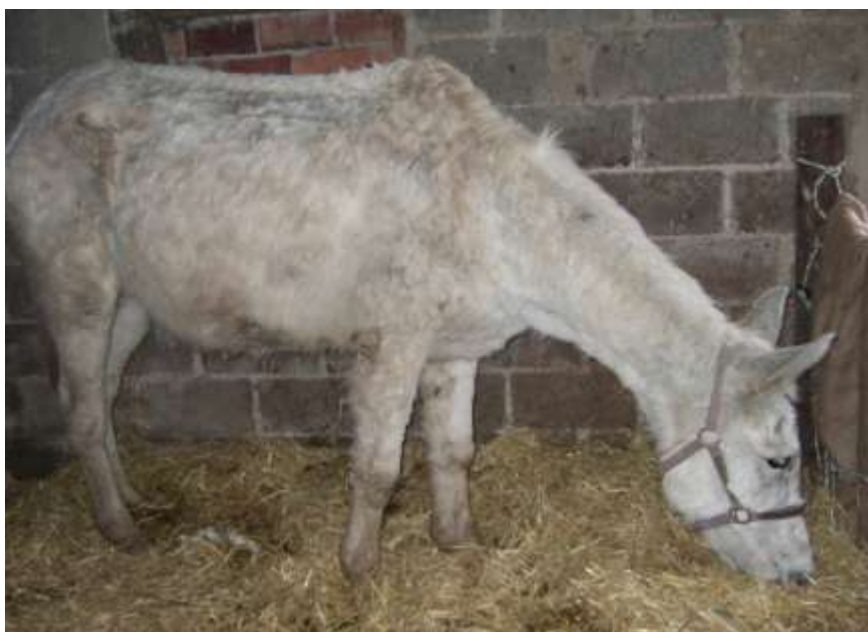
Pablo is de look-alike van het witte paarden Picasso's "Guernica"

Er verblijven nu 20 ezels op het ezelparadijs: